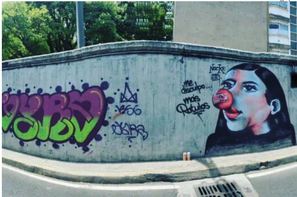
Sandra Cuevas en un grafiti.

La alcaldesa Sandra Cuevas tiró un anzuelo en un agitado mar mediático en el cual ella también picó en su propia caña, pero, ¿cuántos más cayeron en esa red? ¿Quién saca mejores dividendos? ¿Una alcaldesa que por sus “estrafalarias” decisiones cobra notoriedad o una comunidad cultural que no ha tenido la capacidad de defenderse de los atroces recortes presupuestales a la cultura? ¿Una comunidad que se siente ofendida y grita lamentosamente en las redes sociales ante su invisibilidad en la esfera de las decisiones de la política pública?