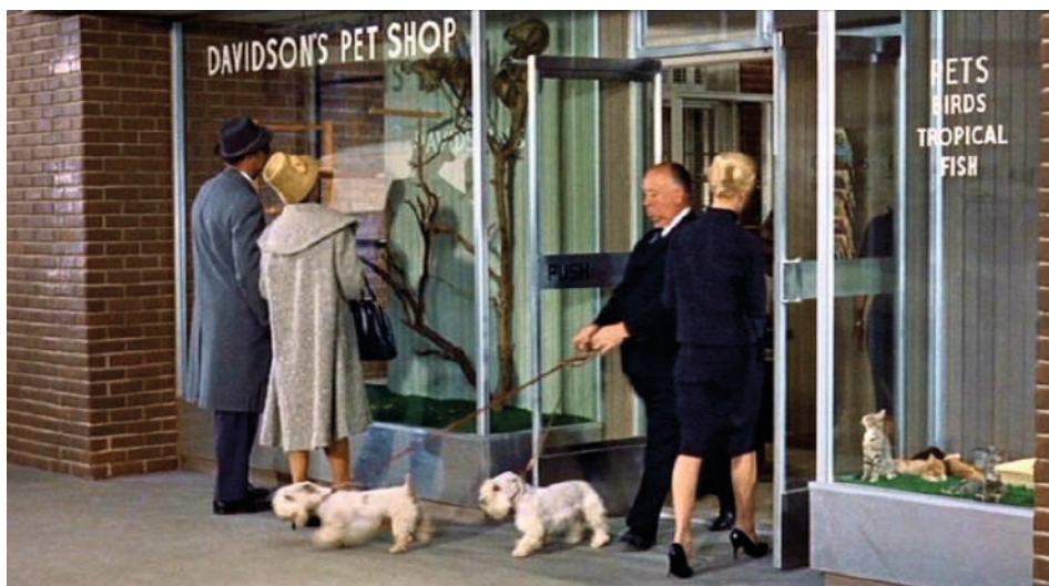
* The Birds (1963).

Al final todo dio resultado. Hitchcock se convirtió en una estrella y su figura la del cineasta más conocido de todos los tiempos.