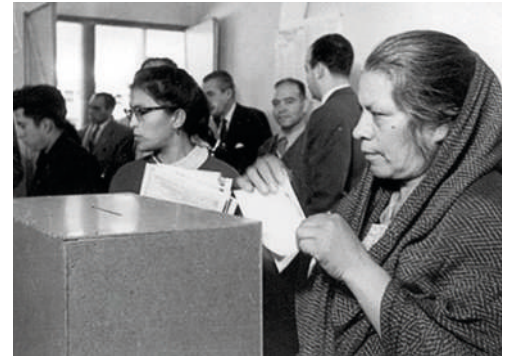
* Voto femenino

Instrucciones. Sudoku se juega en una cuadrícula de 9 x 9 espacios. Dentro de las filas y columnas hay 9 "cuadrados" (compuestos de 3 x 3 espacios). Cada fila, columna y cuadrado (9 espacios cada uno) debe completarse con los números del 1 al 9, sin repetir ningún número dentro de la fila, columna o cuadrado. ¡Mucha suerte!