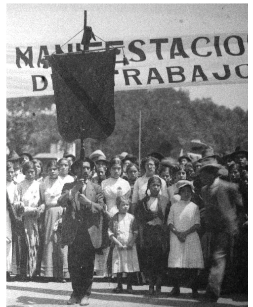
* Manifestación por los derechos laborales.

Se expide la primera Ley Federal del Trabajo, reglamentaria del Artículo 123 Constitucional.