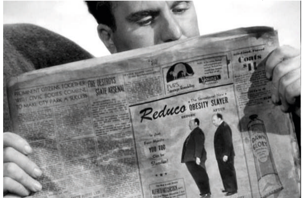
* Lifeboat (1944).

Algunas veces era muy fácil identificarlo, sobre todo cuando hacía algo más que simplemente pasar frente a la cámara, como en Strangers on a train (1951), en la cual sube al tren con un contrabando que es más grande que él, o en To catch a thief (1955), en la que viaja al lado de Cary Grant, quien lo mira extrañado. Sin embargo, no siempre era sencillo verlo, sobre todo en las cintas que se rodaban en una sola locación.